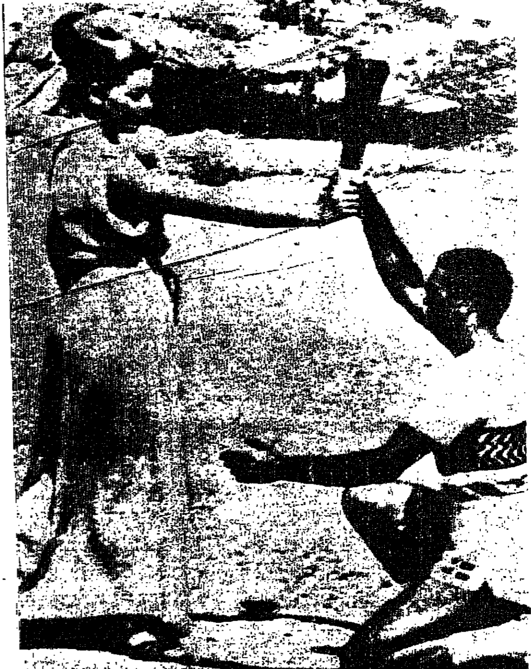
في احتفال تقليدي أقيم على جبل أولمبوس في اليونان سلمت «الامة» للشعلة الاولمبية الى من سيجعلها في طريقه الى مدينة المكسيك لإفناء احتفالات اولمبية بها «صورة لليونانديس».

١٠٠ ميل إلى بواغ دون دلائل (الإفناء) على وجود قوات سوفياتية اغزو قوات خمس دول من حلف وارسو